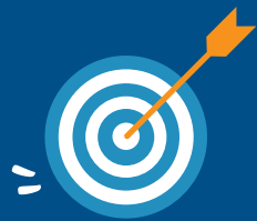
tir à l'arc (à partir de 9 ans)